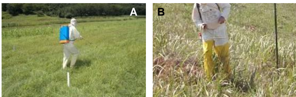
FIGURA 6 – Calibração do pulverizador em área teste (A) e utilização de barra com dois bicos e estaca de bambu servindo como baliza na aplicação (B)

Os herbicidas e as doses devem ser recomendados após a identificação das espécies de plantas daninhas na área, observando os cuidados previstos em lei com o meio ambiente e a segurança do trabalhador. Sempre consultar um Engenheiro Agrônomo ou Técnico Agrícola para uma correta aplicação. Utilize sempre os equipamentos de proteção individual (EPI), completos e limpos. Faça a manutenção, regulagem e calibração do pulverizador, antes da aplicação (FIG. 6).