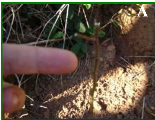
FIGURA 11 - Formigas cortadeiras