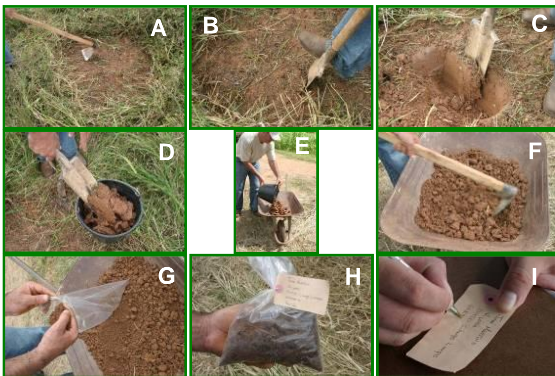
FIGURA 5 – Como realizar a amostragem de solo: retirar material vegetal da superfície (A); Abrir uma pequena tincheira no solo na medida específica para a coleta (B); coleta de material e acondicionamento em balde (C e D); repetir a operação (número de amostras simples retiradas depende da homogeneidade e do tamanho da área) até completar a coleta de toda área amostrada e encaminhar todo solo para destorroamento e mistura até formar mistura mais homogênea possível (E e F); coleta da amostra com cerca de 500g, já acondicionada em saco plástico resistente (G); identificação da amostra (H e I)

As amostras de solo devem ser representativas da área a ser cultivada e mantidas acondicionadas em sacos devidamente fechados e identificados com os dados da área coletada, do proprietário e profundidade de amostragem. Essas devem ser enviadas a laboratórios idôneos e no menor espaço de tempo entre coleta e análise (FIG. 5).