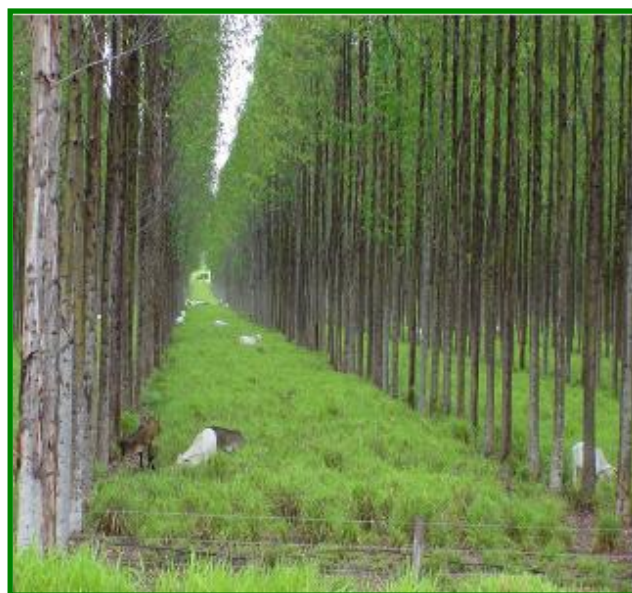
FIGURA 3 - Sistema Silvopastoril com eucalipto e braquiária

A presença dos animais em sub-bosque de florestas plantadas é proposta como alternativa para controle de plantas daninhas, com baixo custo de utilização, quando comparado aos demais métodos de controle. É capaz de minimizar a competição dessas espécies com o componente arbóreo de interesse. Além dessa contribuição, os animais apresentam papel importante no processo de ciclagem de nutrientes no sistema, pois grande parte da biomassa que consomem retorna como fezes e urina ao solo, favorecendo