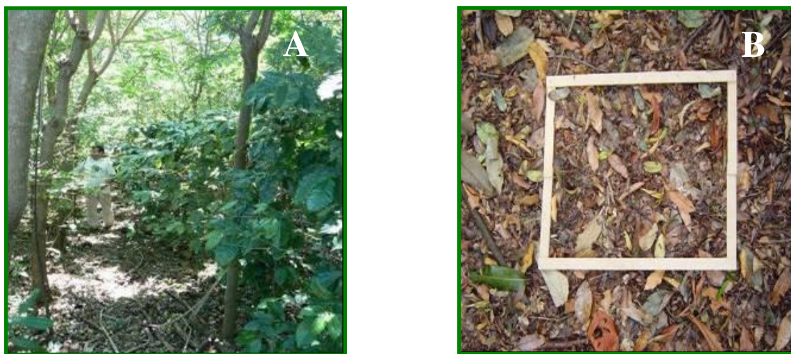
FIGURA 2 - Sistema agrossilvicultural, com café orgânico sombreado. A - Consórcio de café com árvores. B - Detalhe da deposição de folhas no sistema

Um bom exemplo de um sistema agrossilvicultural é o cultivo do café orgânico sombreado, onde as árvores contribuem para melhoria da fertilidade do solo e a retenção de umidade ocasionada pela deposição da serrapilheira (FIG. 2). Em cafezais algumas espécies podem ser utilizadas com alto potencial, como o coqueiro-da-Bahia ( Cocos nucifera ), o abacateiro ( Persea americana ), o sobraji ( Colubrina sp.), o louro-pardo ( Cordia tricotoma ), a gliricídia ( Gliricidia sepium ), os ingás ( Inga spp.), o jenipapo ( Genipa americana ) (Araújo, 1993), além de outras como pupunha ( Bactris gasipaes ), cacau, o palmitero ou juçara ( Euterpe edulis ), o açazeiro ( Euterpe oleraceae ) e madeiras de lei, como o mogno ( Swietenia macrophylla ) e freijós ( Cordia alliodora , Cordia goeldiana ).