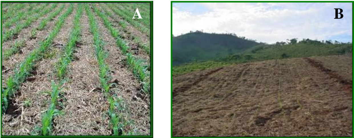
FIGURA 9- Milho crescendo na palhada de braquiaria (A), detalhe do cultivo do milho entre as faixas da espécie arbórea (B)