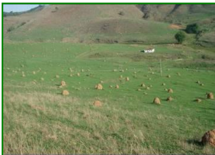
FIGURA 1 - Área de pastagem degradada, infestada por cupins

A degradação das pastagens, caracterizada pela perda da capacidade produtiva, pela exposição do solo, pela infestação de plantas daninhas e de cupinzeiros (FIG. 1) é preocupante. A recuperação dessas áreas degradadas deve servir de estímulo para desenvolvimento de alternativas rentáveis, com potencial para modificar, significativamente, a produtividade, a lucratividade e a sustentabilidade da propriedade.