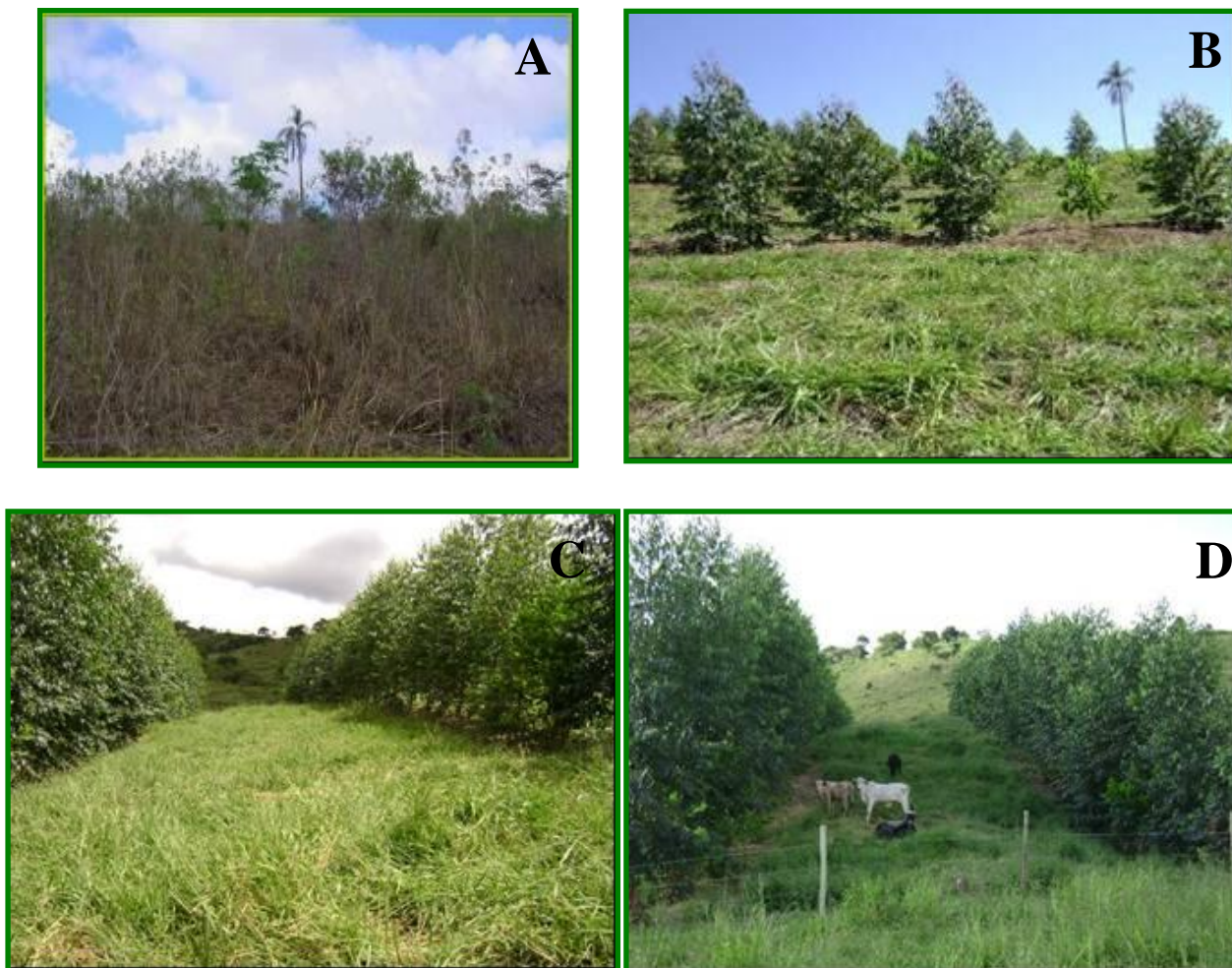
FIGURA 4 – Sistema Agrossilvipastoril no município de Viçosa – MG. Pastagem degradada antes da implantação do sistema, com alta infestação de plantas daninhas (A); pastagem recuperada e desenvolvimento de árvores, aos 30 dias após colheita do milho (B); entrada dos animais e estágio de desenvolvimento das espécies arbóreas um ano após o plantio (C e D)