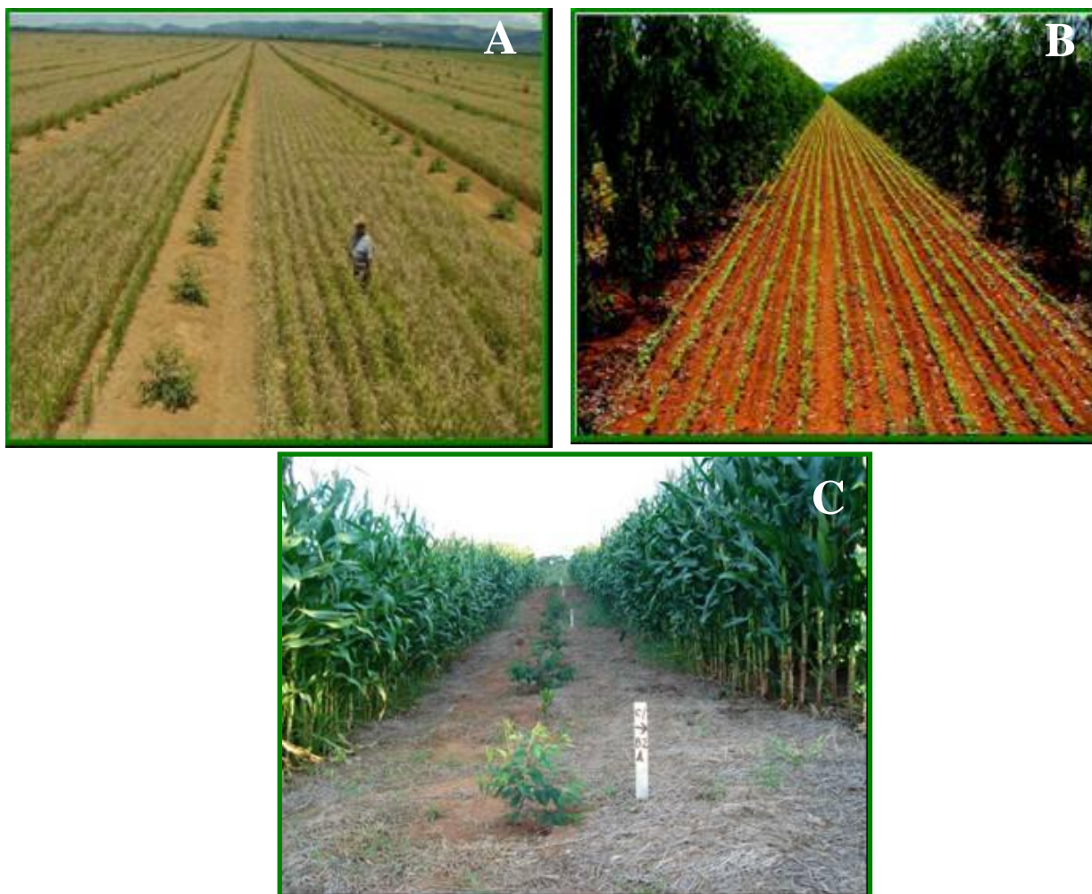
FIGURA 7- Arroz cultivado no primeiro ano (A) e soja no segundo (B), ambas com eucalipto e milho + braquiária + eucalipto e Acacia mangium cultivados juntos no primeiro ano em Sistema Agrossilvipastoril (C)

A adubação utilizada na cultura agronômica é a recomendada para altos níveis de produção, pensando no aproveitamento do remanescente da adubação pelas forrageiras.