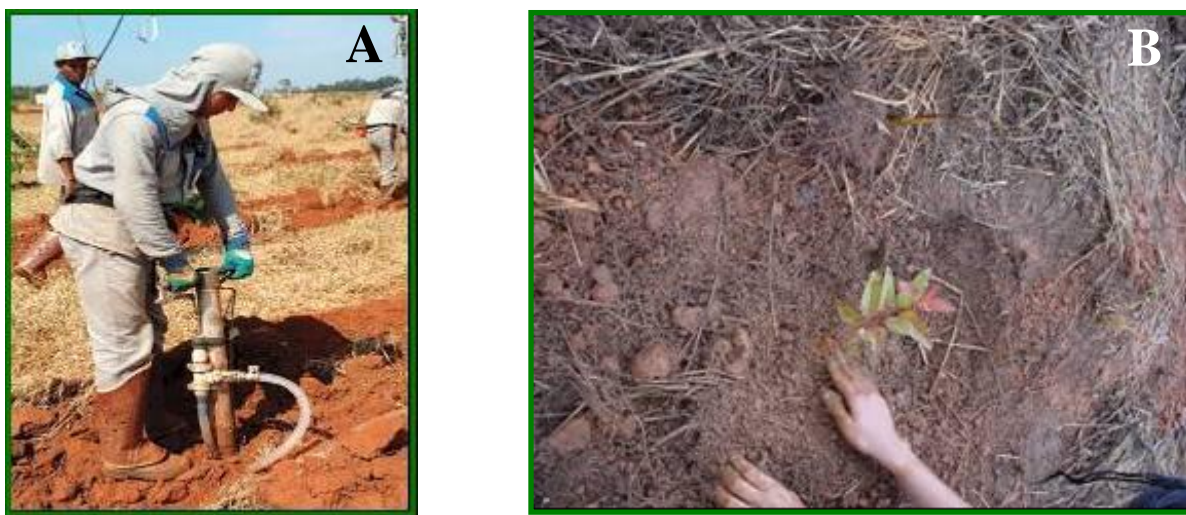
FIGURA 8 - Plantio de muda com plantadeira acoplada a dispositivo de aplicação de hidrogel (A) e plantio manual em dia chuvoso (B)

Um recurso bastante interessante para as condições norte-mineira é o uso de hidrogel no plantio, que tem a função de reter a umidade do solo, diminuindo a necessidade de irrigação nas primeiras semanas pós-plantio (FIG. 8).