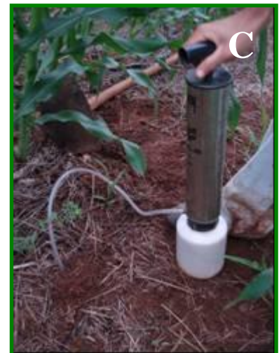
FIGURA 12 - Controle de formigas cortadeiras. Eucalipto atacado por formigas cortadeira (A). Pulverização no “olho do formigueiro” com termonebulizador (B) e polvilhadeira (C)

Os cupins atacam a parte subterrânea das plantas, destruindo o sistema radicular da muda e impedindo a absorção de água e de nutrientes. A planta torna-se amarelada e ressecada, principalmente nos dias ensolarados e quentes, e acaba morrendo (FIG. 13).